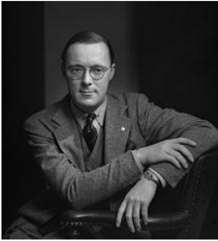
Bernhard van Lippe-Biesterfeld nel 1942.

Il successo di questo primo incontro spinse gli organizzatori a pianificare delle conferenze annuali. Fu istituita una commissione permanente con Retinger nel ruolo di segretario permanente. Alla morte di Retinger divenne segretario l'economista olandese Ernst van der Beugel nel 1960 e in seguito la posizione fu rivestita da Joseph E. Johnson , William Bundy e altri. [10] Molti partecipanti al gruppo Bilderberg sono capi di Stato, ministri del tesoro e altri politici dell' Unione europea ma prevalentemente i membri sono esponenti di spicco dell'alta finanza europea e anglo-americana.