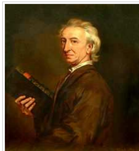
John Evelyn, uno dei fondatori dell'accademia